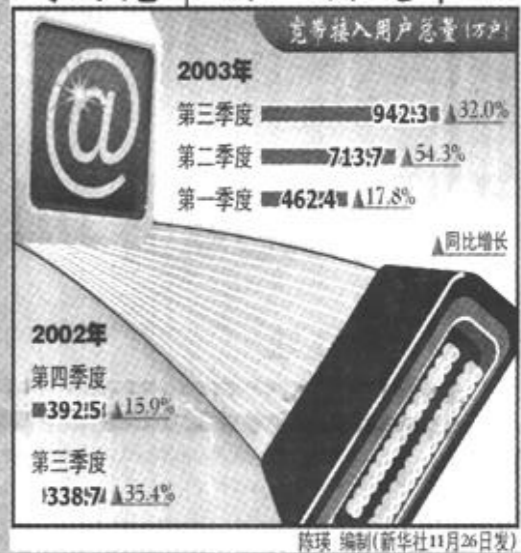
陈琛 编制(新华社11月26日发)