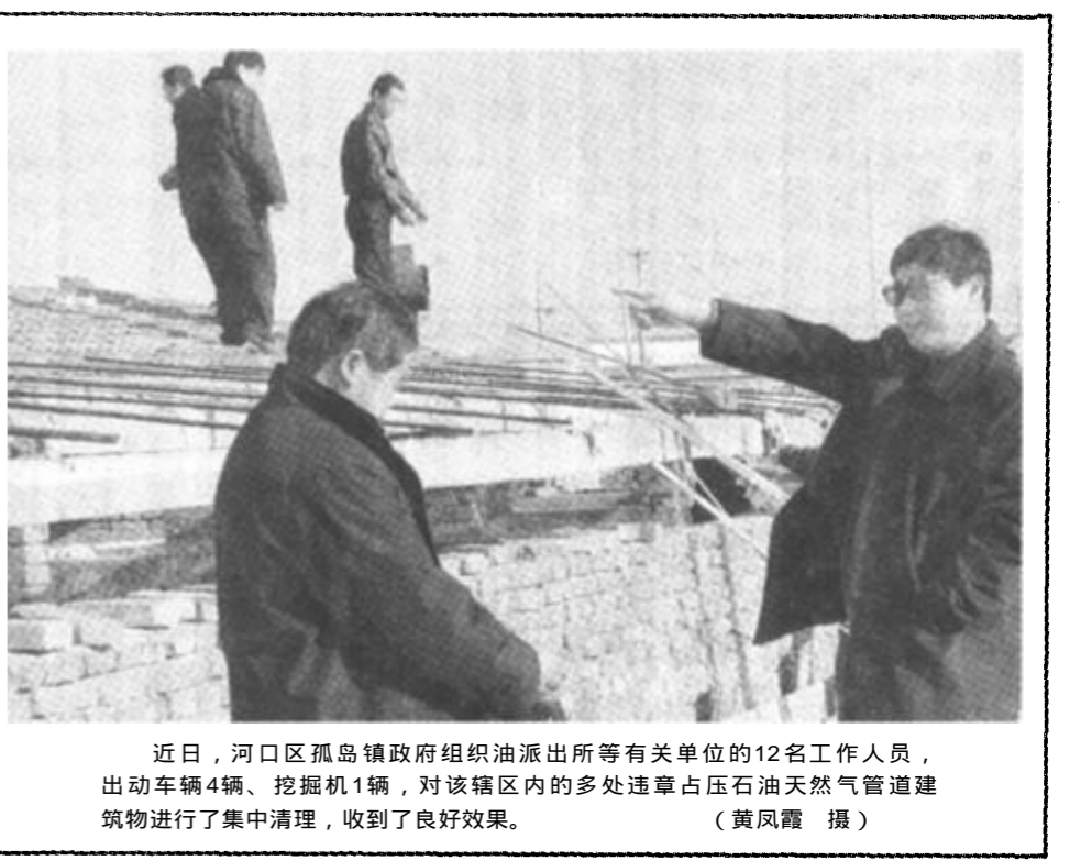
近日，河口区孤岛镇政府组织派出所等有关单位的12名工作人员，出动车辆4辆、挖掘机1辆，对该辖区内的多处违章占压石油天然气管道建筑物进行了集中清理，收到了良好效果。

成立了社区残疾人康复服务中心。根据残疾人康复服务需求，设立了残疾人康复服务中心，内设残疾人康复训练、康复治疗、残疾人培训等服务设施，建成残疾人康复、训练、培训为一体的残疾人综合服务中心。成立了社区残疾人协会，积极开展社会救助、以残助残等活动。活动开展以来，已组织健康知识培训2次，义务为老年人、残疾人查体1次，开展义诊4次，入户提供医疗卫生服务89人次。(岳建美)