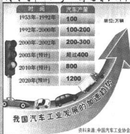
张立云 编制(新华社11月26日发)