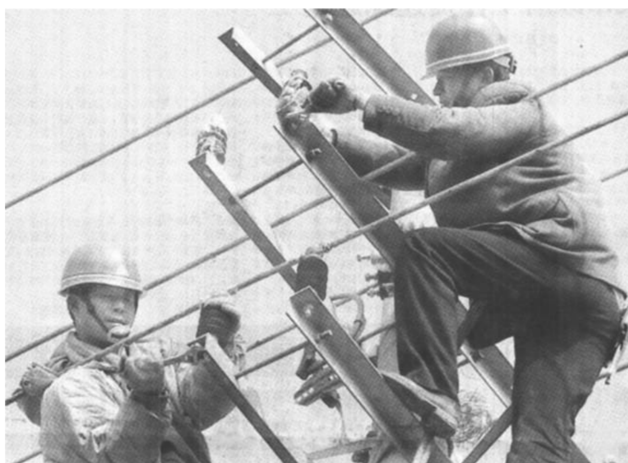
为了使全县人民冬季生产生活用电无忧,广饶县供电公司结合秋检工作,组织职工开展安全用电检查。图为职工正在认真检修线路。 (黄文俊 侯国庭 摄)

近年来,东营区十分重视做好低保户的脱贫工作,为了让农村低保对象彻底摆脱贫困,这个区民政部门在对救助对象进行资金救助的基础上,采取提供信息技术、扶持上致富项目等多种措施帮助有就业能力的低保人员实现再就业。两年来,共向全区农村低保对象送致富信息1000余条,帮助低保对象上致富项目100多个,100多名低保对象在民政部门的帮助下走上了致富路。 六户镇东六户村的苏得胜1993年外出打工因车祸造成双腿残疾,天灾人祸使这个原本就步履维艰的家庭雪上加霜,民政部门在了解到这些情况后,及时为他送来了粮食和救济款,并且帮助他建起了波尔山羊养殖小区,为他提供养羊技术帮助,随着养殖规模的不断扩大,苏得胜日子一天比一天红火,生活好了的苏得胜做的第一件事就是退出低保。如今,在东营区像苏得胜一样通过民政部门扶持致富项目而退出低保范围的已有100余人。对于城市低保对象,东营区民政部门针对低保对象中下岗失业职工过多的实际,采取因人而异、因家庭而异的办法,通过社区服务热线,积极开展“送岗位到家”活动,受到了低保对象的热烈欢迎,截至目前,东营区已有1200多名低保对象在民政部门的帮助下找到了新的工作岗位。 (尹文盛 徐欣荣 孙学凯)